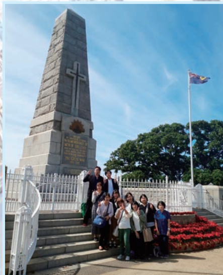
▲ 州立戦争記念碑の前で

私たち職員 20 名は、オーストラリア・パースへ研修旅行に行ってきました。博愛会 4 年ぶりの海外研修は、10 月 13 日発、11 月 9 日発の 2 班での研修となりました。