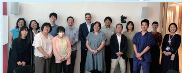
▲ フィオナ・スタンレー・ホスピタルにて