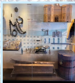
▲ フリーマントル刑務所