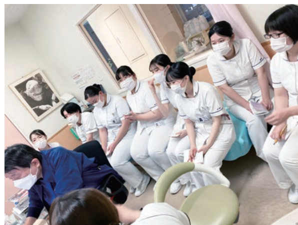
▲ 主治医の指示受け