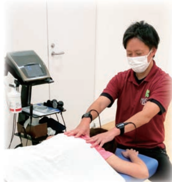
▲『リハビリ』サービス ラジオ波を用いた治療場面

2023年9月下旬より NASPA II において『リハビリ』サービスの提供を開始しました。「腰やひざの痛みを和らげ、楽しく生活したい」、「手術後の可動域制限や痛みを改善したい」などのご希望に寄り添い、筋肉や関節の不調に対して物理療法や手技を用いて治療するだけでなく、痛みへの対処方法や、痛みの原因となる動きや姿勢の改善までをお手伝いさせていただきます。また脳卒中後、パーキンソン病などの各種疾患や、介護予防のためのトレーニングまで幅広い用途で個別機能訓練としてご利用いただくことが可能です。理学療法士による施術とスポーツクラブであることを活かした個別トレーニングを組み合わせることによって、会員様の目標達成を全力でサポートさせていただきます。現在、平日の午後を中心に週4～5回提供できる体制を整えております。また健康寿命の延伸には運動だけでなく、栄養、嚥下機能の重要性が注目されています。NASPA II では、言語聴覚士による嚥下機能、口腔機能、言語機能への『リハビリ』サービスも対応可能です。