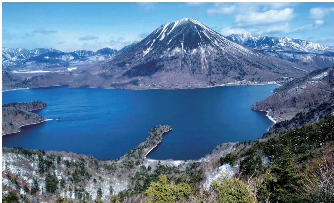
「半月山から中禅寺湖を介して男体山をのぞむ」

菅間 附属診療所 TEL: 0287-67-1570 菅間 在宅診療所 TEL: 0287-73-5934 地域包括総合ケアセンター TEL: 0287-62-3311 NASPA(フィットネス) TEL: 0287-67-1577 那須看護専門学校 TEL: 0287-67-1188