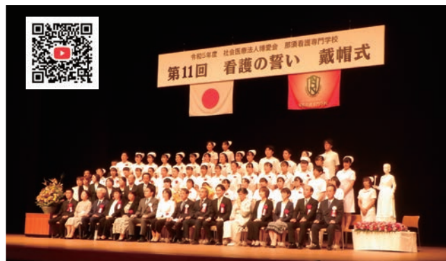
▲ 式典後の写真撮影の様子（QRからご動画を観いただけます）