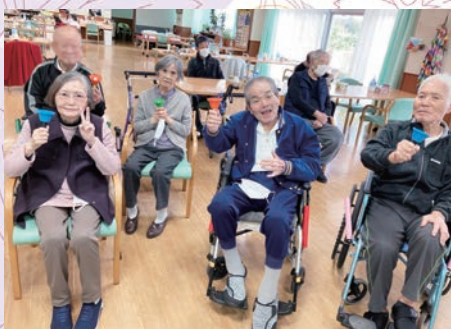
▲ ハンドベルサークルの皆様

かんかんアカデミーにはハンドベルサークルがあり、利用者の皆様が楽しく練習しております。ハンドベルは片手で演奏でき、力が弱くても音を奏でられるため、高齢者の方でも十分楽しんでいただけます。「きよしこの夜」に始まり、「夕焼け小焼け」や「ふるさと」…レパートリーも少しずつ増えてきました。音のズレもご愛嬌！自分の順番にドキドキしながらも毎日にぎやかに練習しています！