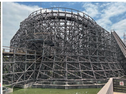
▲ 埼玉県 東武動物公園 (レジーナII)

一途をたどっている木製コースターについてです。金属製には味わえない激しい横揺れや振動、木材のきしみで一味違った絶叫を味わえます。また、木で組まれた見た目も圧巻で、芸術的な側面を持つことも特徴です。国内の大型木製コースターは大分県城島高原パークの「ジュピター」、大阪府ひらかたパークの「エルフ」、営業終了から3年半の2023年にニューアルすることで復活をとげた埼玉県東武動物公園の「レジーナII」を残すところとなりました。皆様、木製コースターが国内から無くなる前にぜひ一度ご賞味あれ！