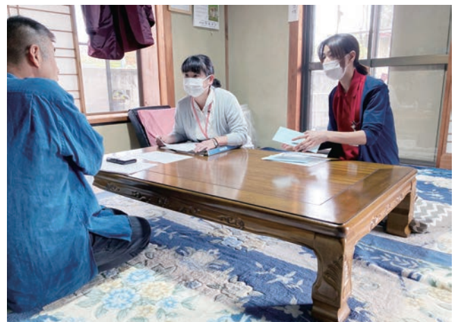
▲ 担当者会議の様子