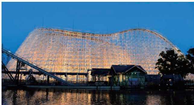
▲ 三重県 ナガシマスパーランド (2018年営業終了のホワイトサイクロン、現在は白鯨にリニューアル)

皆様、日常に刺激は足りていますか？ルーチン化してしまった日常に輝きを与えてくれるのが、極度に非日常的な体験を味わうことだと思っています(持論)。私は無類の絶叫系アトラクション好きで、休日には日本中の絶叫と名の付くアトラクションをめぐる、非日常体験を味わっています。その中でも、ジェットコースターには目がなく、国内にとどまらず、海外まで手を伸ばしています。今回紹介するのが、メンテナンスの維持コストから年々数を減らし、絶滅の