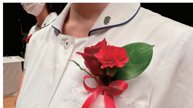
▲ 9月の戴帽式典。コサージュを胸に式典へと臨む