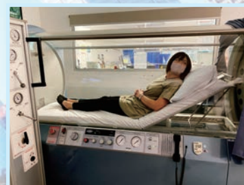
▲ FSH の高圧酸素治療装置